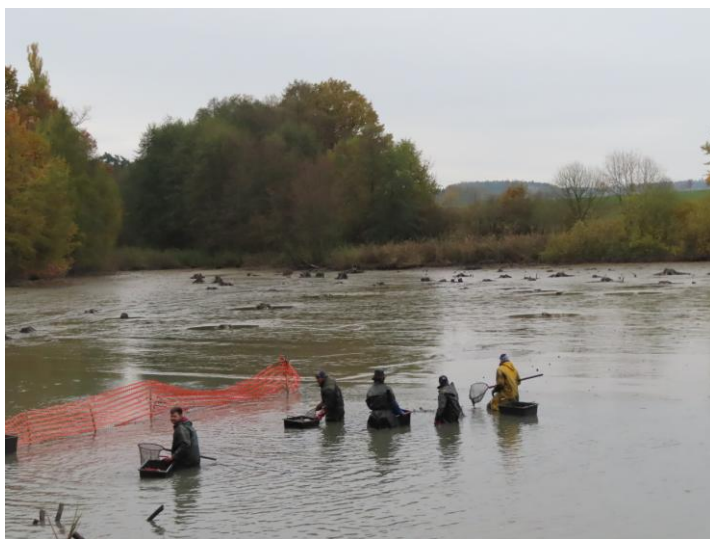
Výlov rybníka Křídlo